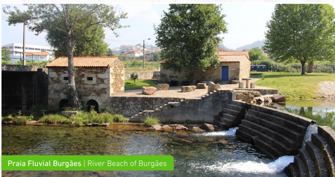
Praia Fluvial Burgães | River Beach of Burgães