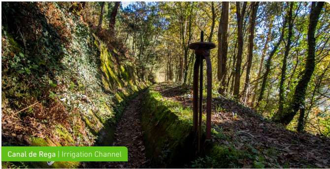
Canal de Rega | Irrigation Channel

After 2.5 km in this ingenious trail, the route descends again to channel number 1 to quickly return to Malhõ and proceed along the return path to the River Beach.