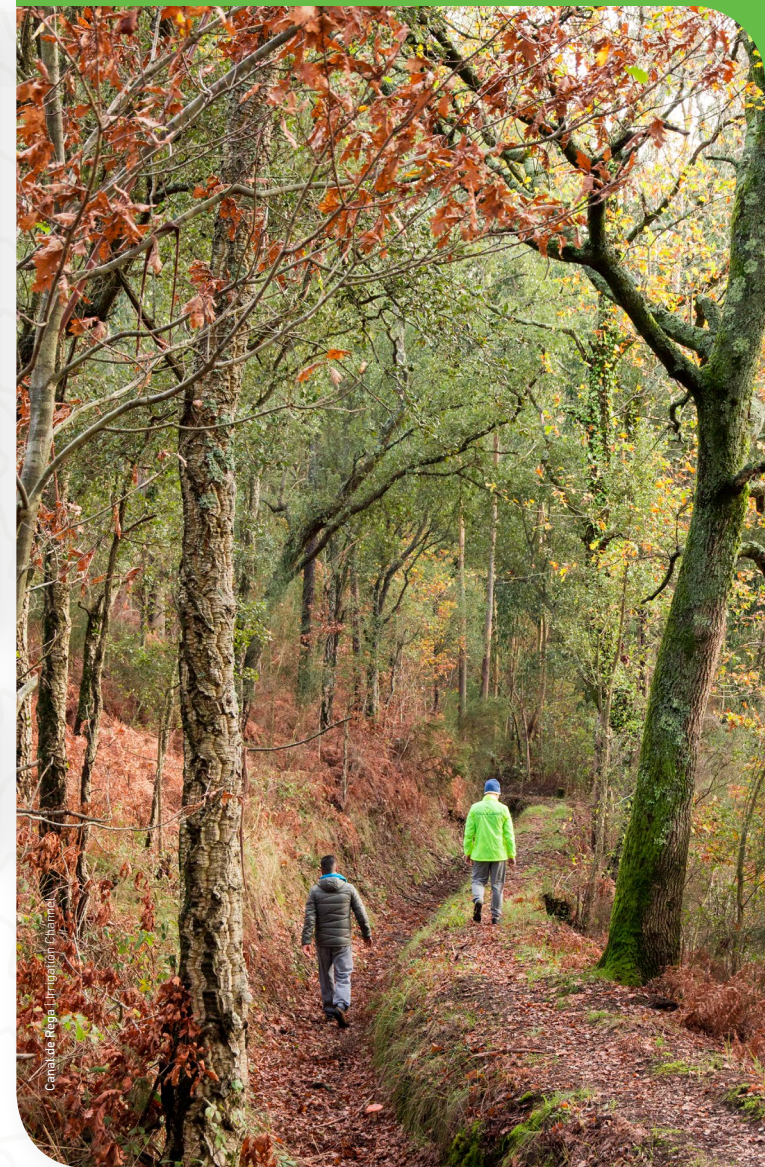
Canal de Rega | Irrigation Channel