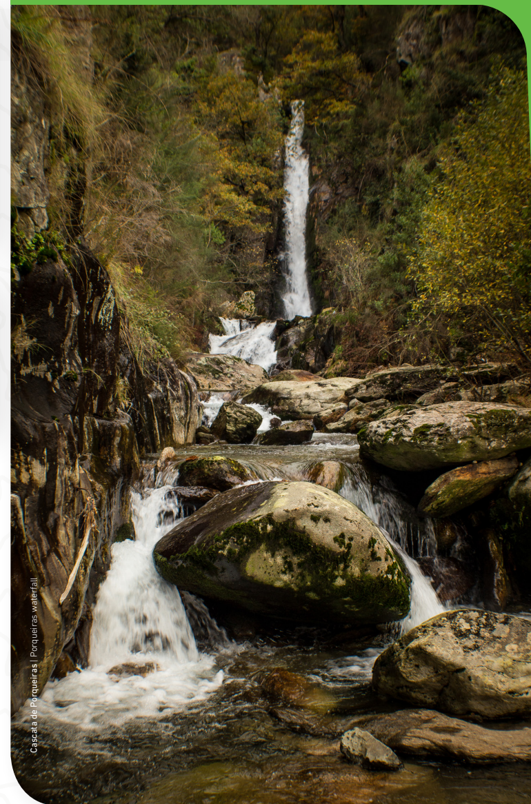
Cascata de Porqueiras | Porqueiras waterfall