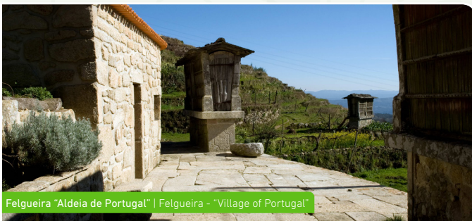
Felgueira "Aldeia de Portugal" | Felgueira - "Village of Portugal"

The Paraduça River, a subsidiary of the Teixeira River, takes advantage of the fault line to excavate its own valley, clearly separating the Freita Mountain Range from the Arestal Mountain Range, which begins precisely in the village of Felgueira. The granitic outcrop presents some "boroa" stones (granite blocks that suffered polygonal fracturing, which caused the rock surface to have a distinctive appearance, similar to bread crusts) as well as the ancestral marks of the artisanal exploration of this type of rock. The imposing Freita Mountain Range is punctuated by the meteorological tower of Freita. At these altitudes, it is possible to highlight the mountain grasslands ("lameiros"), with interesting species like the Gentiana, the Petticoat Daffodil (Narcissus bulbocodium) and the Marsh Fritillary (Euphydryas aurinia). The Centaurea, found in more arid terrain, amazes those who observe it with its delicate and finely divided petals. In the pine forests, it is possible to find small patches of oak trees where there is the opportunity to listen to the singing of the Bullfinch (Pyrrhula pyrrhula) and the drumming of the Great Spotted Woodpecker (Dendrocopos major) in the tree trunks, while searching for food. The Eagle Owl can also be heard in the Arestal Mountain Range, due to its powerful vocalizations that echo through the night.