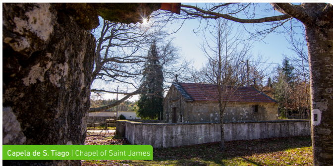
Capela de S. Tiago | Chapel of Saint James

The distance from this village to the Sanctuary of the Lady of Health ("Senhora da Saúde") is of 2.4km, always through forest paths, which initially ascend but then finish with a generous descent back to the starting point.